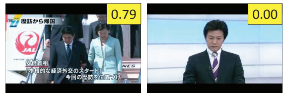
(a) スコアが高い例 (b) スコアが低い例